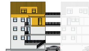
Ansicht Nord 2. OG + DG | Wohnung 5