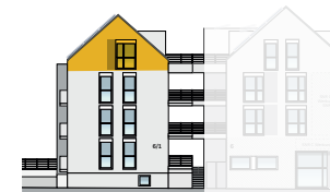
Ansicht Ost 2. OG + DG | Wohnung 5