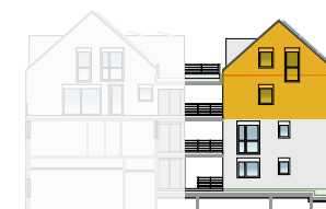
Ansicht West 2. OG + DG | Wohnung 5