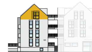
Ansicht Ost 2. OG + DG | Wohnung 5