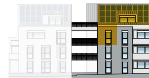
Ansicht Süd 2. OG + DG | Wohnung 5