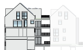
Ansicht West 2. OG | Wohnung 13