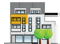
Ansicht Nord 2. OG | Wohnung 13