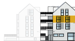
Ansicht Ost 2. OG | Wohnung 13