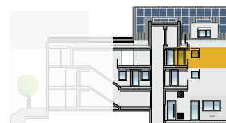
Ansicht Süd 2. OG | Wohnung 13