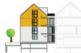
Ansicht Ost 2. OG + DG | Wohnung 8