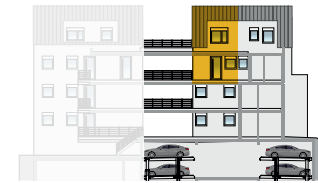
Ansicht Nord 2. OG + DG | Wohnung 8