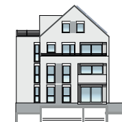
Ansicht West 2. OG + DG | Wohnung 8