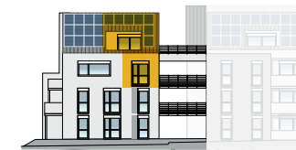
Ansicht Süd 2. OG + DG | Wohnung 8