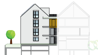
Ansicht Ost 2. OG + DG | Wohnung 9