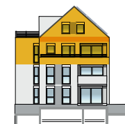
Ansicht West 2. OG + DG | Wohnung 9