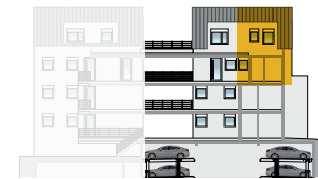
Ansicht Nord 2. OG + DG | Wohnung 9