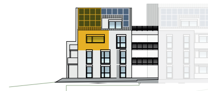
Ansicht Süd 2. OG + DG | Wohnung 9